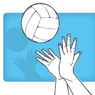
"Gator" hit krokodillen techniek