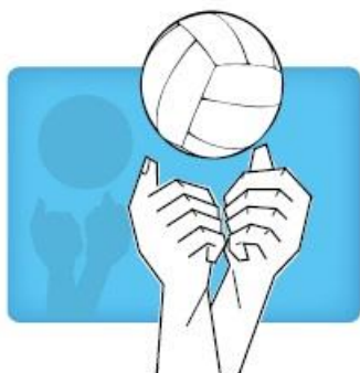
Overhand two handed "punch" twee handige stomp