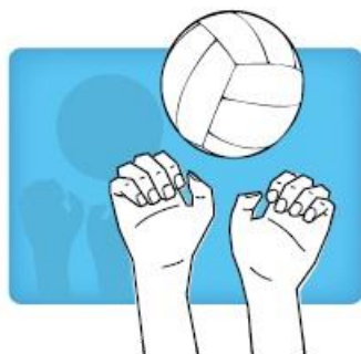
"Tiger" Fingers spelen met de knokkels