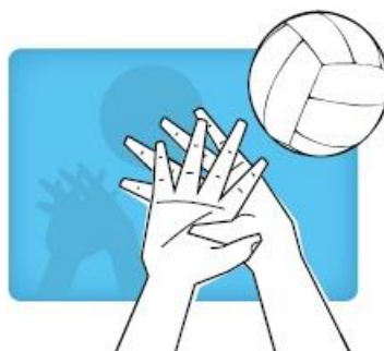
Overlapping hands overlappende handen