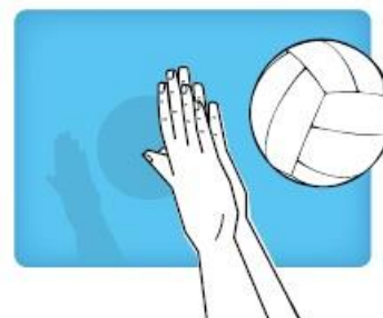
Chopping two handed action twee handige hak beweging